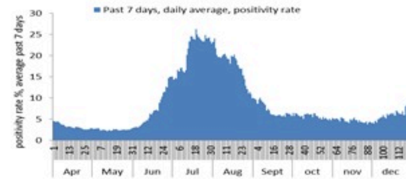
نسبة إيجابية الفحوصات (معدل 7 أيام الاخيرة)