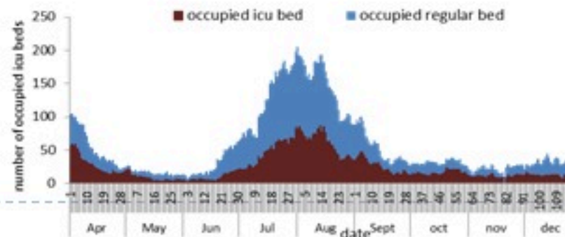
عدد الأسرة المستعملة