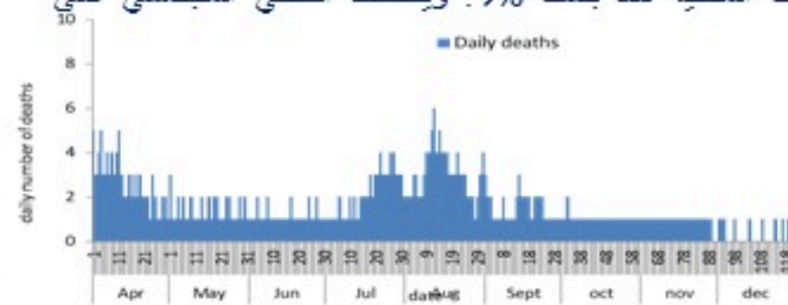
عدد الوفيات حسب اليوم

سيتم التركيز على المؤشرات الخاصة بالحالات الشديدة. في الأيام 7 الأخيرة، تم تسجيل 3 وفيات (0.06 لكل مئة ألف). وبلغت نسبة استعمال اسرة العناية الفائقة 8% (14 أسرة من اصل 182). اما نسبة إيجابية الفحوصات المحلية فقد بلغت 9%. ويصنف التفشي المجتمعي على مستوى 3.