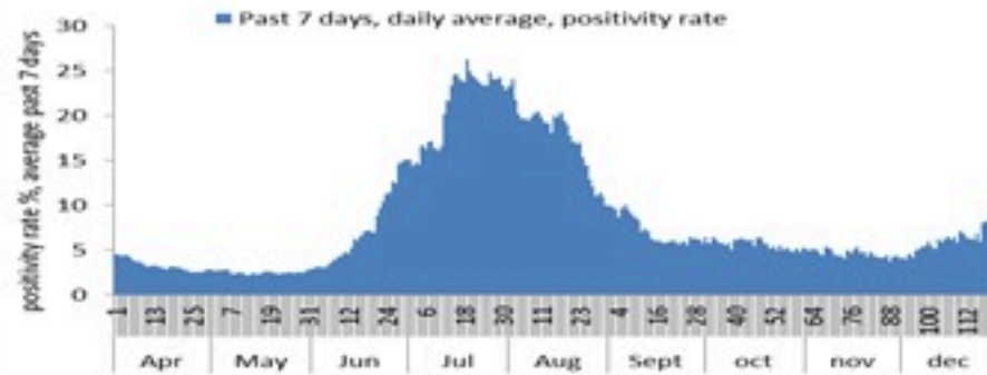
نسبة إيجابية الفحوصات (معدل 7 أيام الاخيرة)