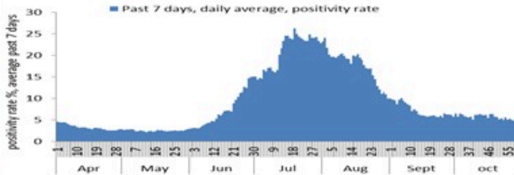
نسبة إيجابية الفحوصات (معدل 7 أيام الأخيرة)