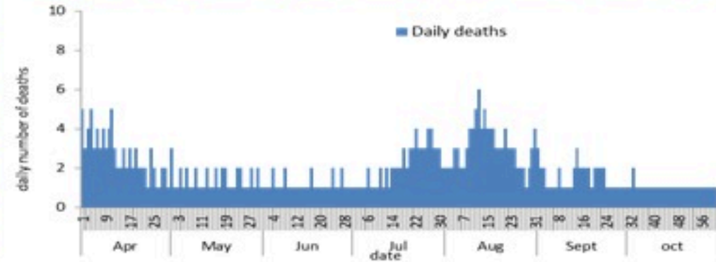
عدد الوفيات حسب اليوم

سيتم التركيز على المؤشرات الخاصة بالحالات الشديدة. في الأيام 7 الأخيرة، تم تسجيل 7 وفيات (0.13 لكل مئة ألف). وبلغت نسبة استعمال أسرة العناية الفائقة 8% (14 أسرة من أصل 182). أما نسبة إيجابية الفحوصات المحلية فقد بلغت 5.2%. ويصنف التفشي المجتمعي على مستوى 2.