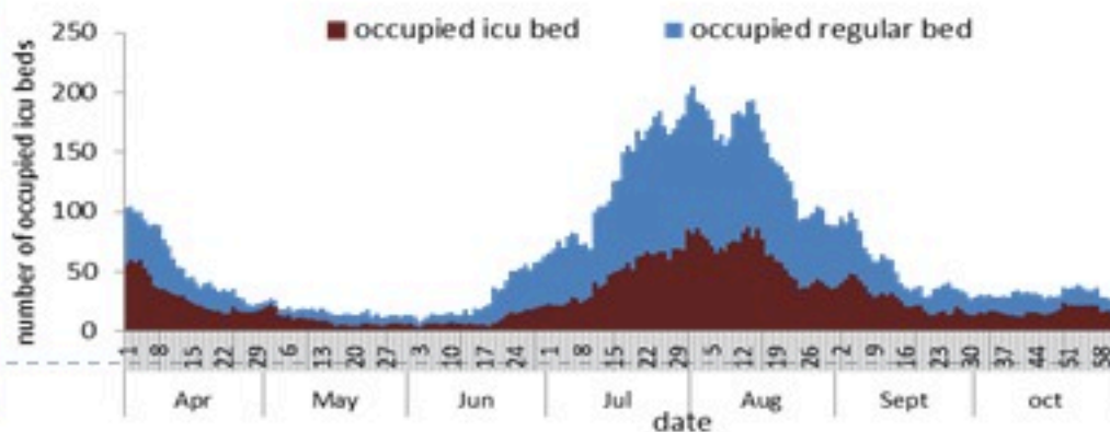
عدد الاسرة المستعملة