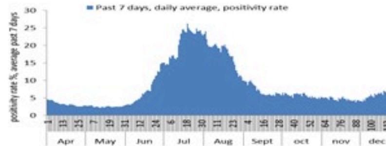
نسبة إيجابية الفحوصات (معدل 7 أيام الاخيرة)