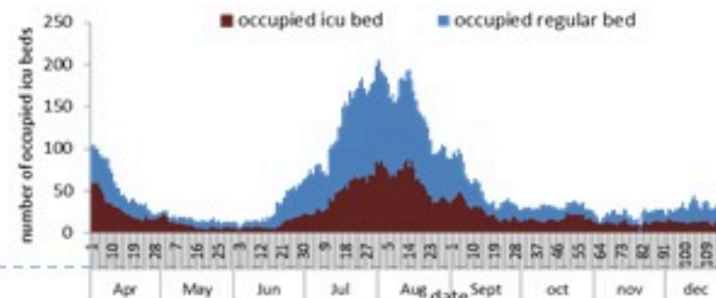
عدد الأسرة المستعملة