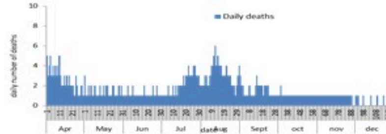
عدد الوفيات حسب اليوم

سيتم التركيز على المؤشرات الخاصة بالحالات الشديدة. في الأيام 7 الأخيرة، تم تسجيل حالتين وفاة (0.04 لكل مئة ألف). وبلغت نسبة استعمال أسرة العناية الفائقة 10% (18 أسرة من أصل 182). أما نسبة إيجابية الفحوصات المحلية فقد بلغت 8.2%. ويصنف التفشي المجتمعي على مستوى 2.